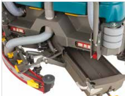
Bac à déchets