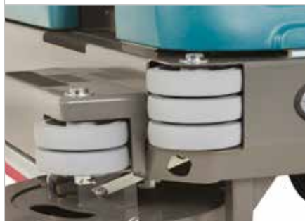
Châssis et butoirs d'angle renforcés

Un toit de protection protège l'opérateur contre les chutes d'objets.