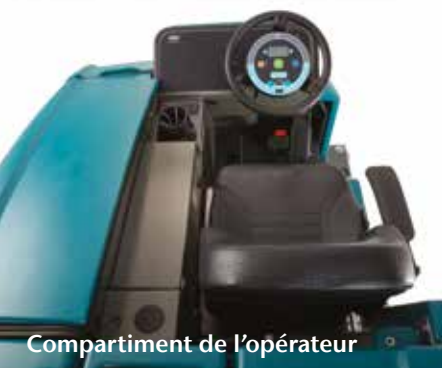
Compartment de l'opérateur