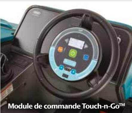
Module de commande Touch-n-Go™